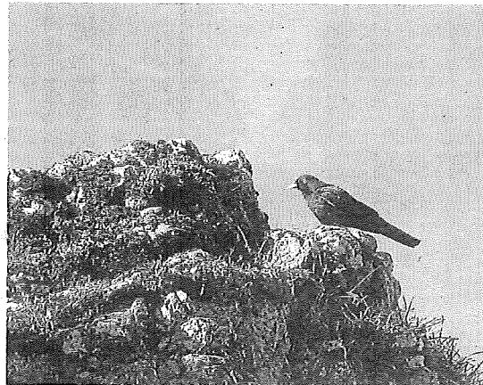
Ave alpina.

El estudio confirma la presencia del bisbita alpino en el parque de