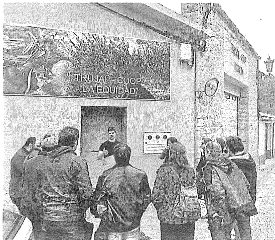
Un grupo de visitantes en el trujal de Moreda.