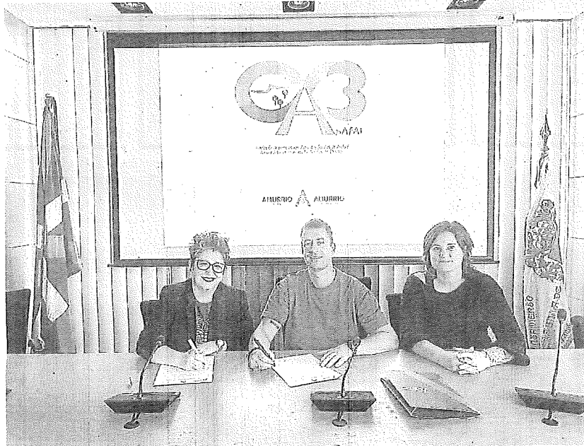
El Ayuntamiento firmó el pasado octubre un convenio con la asociación Apafai.

Asimismo, la asociación anima a las personas con TEA y a sus familias a ponerse en contacto con la entidad para compartir experiencias, necesidades y construir soluciones colectivas con el apoyo de la comunidad. Se puede contactar con Apafai a través de sus redes sociales y canales habituales, entre ellos Ins-