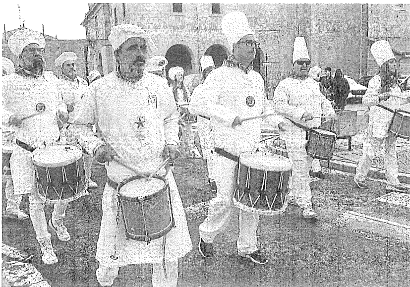
Tamborrada de Dulantzi de 2025.