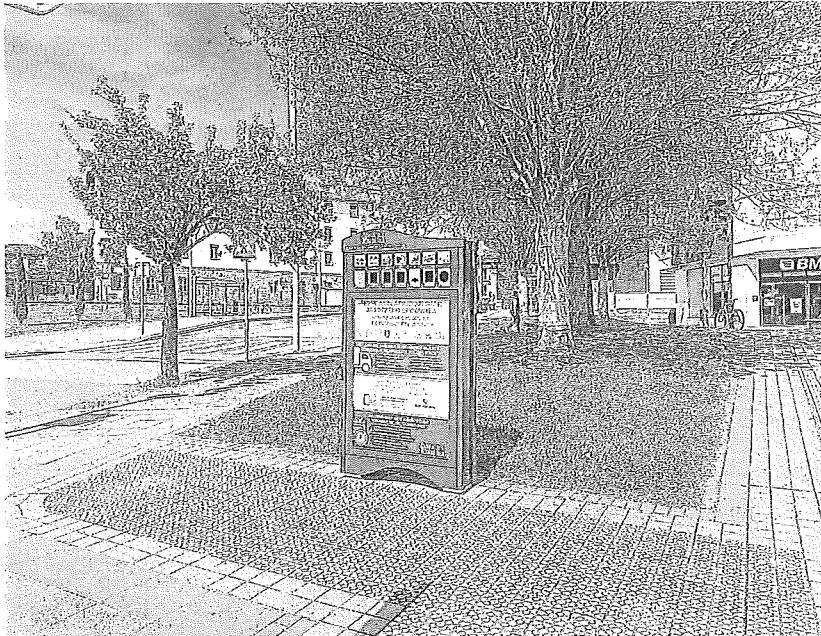
El nuevo minipunto limpio o 'ekogune' de la calle Araba en Amurrio.

A estas incorporaciones se suman trabajos de actualización y mejora de los 20 equipos ya existentes, con el fin de prolongar su vida útil y optimizar el servicio ofrecido a la ciudadanía.