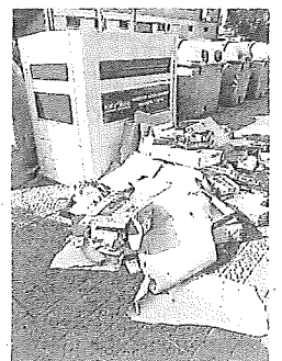
Basura en aceras.

Por su parte, la Diputación alavesa, que se encarga de la recogida del cartón y papel, “sigue sin resolver el problema, ofreciendo un servicio pésimo a los ciudadanos. Los camiones vacían los contenedores y el personal recoge los cartones del suelo y los introduce en el contenedor, quedando de nuevo lleno, con lo que los vecinos se ven abocados a dejar los papeles y cartones alrededor del contenedor”, ha asegurado Sáez de Viana que, coincidiendo con lo que lleva semanas pidiendo el propio Ayuntamiento de Laudio, no ha dudado en reclamar al PNV, en la Diputación y en la Cuadrilla ayalesa que, “cuanto antes”, gestione bien el servicio, porque “está siendo vergonzoso”. – A.O./NTM