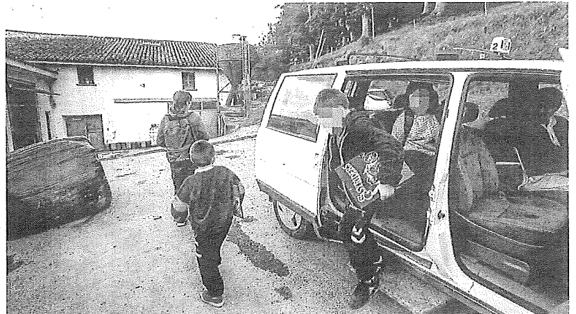
Un servicio de transporte a una zona rural en Álava. e.c.