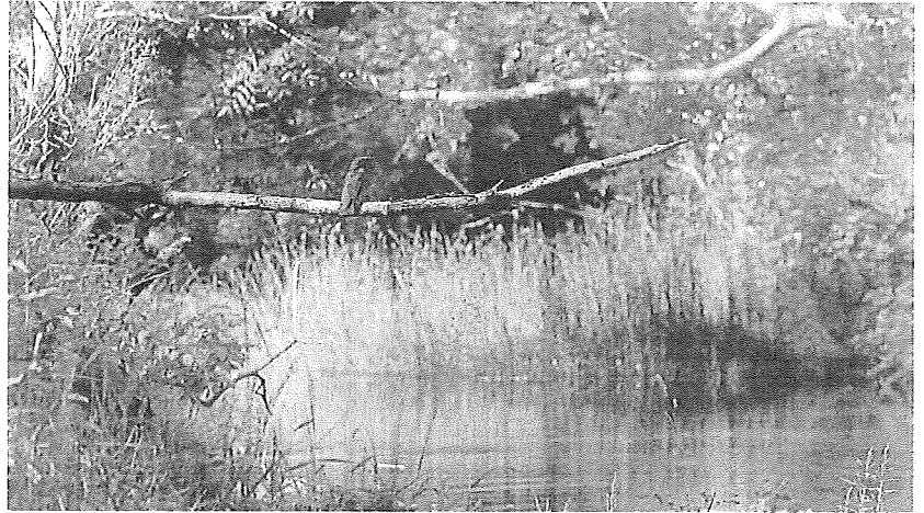
Imagen del documental 'Bihotza, la vida en Álava como nunca la habías visto'.

Bihotza, la vida en Álava como nunca la habías visto es un documental producido por Fundación Vital y Kutxabank y grabado íntegramente en Álava durante tres años por un amplio equipo de profesionales. La cinta muestra a lo largo de 45 minutos y a través de 15 episodios breves, la inmensa riqueza medioambiental de nuestro Territo-