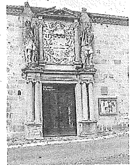
Palacio Lazarraga.

Álava será uno de los lugares más privilegiados de Euzkadi para contemplarlo, ya que se encuentra plenamente dentro de la franja de totalidad de la sombra lunar. Es el primer eclipse total de Sol en la España peninsular desde 1905. En el caso de Álava, no se vivía un fenómeno igual desde 1860. Ocurrirá en pleno verano y muy cerca de la puesta de Sol, creando el efecto de un doble atardecer, y sucederá casi en la fecha cumbre de las Perseidas (las Lágrimas de San Lorenzo), multiplicando el atractivo del cielo nocturno esa semana. - E.S.P.