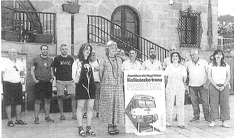
Cargos de EH Bildu reunidos este lunes frente a la estación de tren de Laudio.