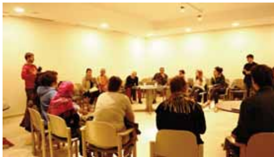
ZER HEZKUNTZA MOTA NAHI DUGU?/¿QUÉ TIPO DE EDUCACIÓN QUEREMOS?

Laguntzailea/Colabora: Oyón-Oiongo Udala/Ayuntamiento de Oyón-Oion.