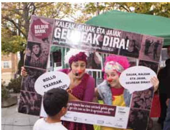
LURRIKARA EGUNA/DÍA DE LA JUVENTUD.