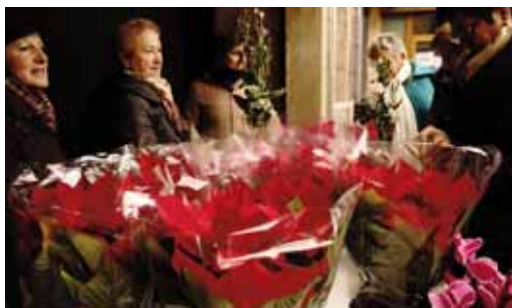
KANPAINA SOLIDARIOA. LORE-SALMENTA/CAMPAÑA SOLIDARIA. VENTA DE FLORES.