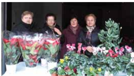
KANPAINA SOLIDARIOA. LORE-SALMENTA/CAMPAÑA SOLIDARIA. VENTA DE FLORES.