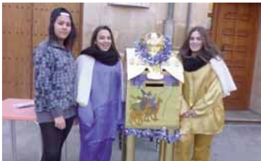
ERREGE MAGOEI GUTUNAK EMATEA/ENTREGA DE CARTAS PARA LOS REYES MAGOS.

Laguntzailea/Colabora: Oyón-Oiongo Udala/Ayuntamiento de Oyón-Oion.