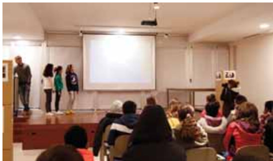
ARABAR ERRIOXAKO IKASLEEN ERAKUSKETA: "NOLAKO ESKOLA NAHIKO GENUKE?/EXPOSICIÓN DEL ALUMNADO RIOJA ALAVESA SOBRE EL PROYECTO ¿CÓMO QUEREMOS QUE SEA NUESTRA ESCUELA?

Antolatzailea/Organiza: San Bizente Ikastolako IGE/AMPA Ikastola San Vicente. Laguntzailea/Colabora: Oyón-Oiongo Udala/Ayuntamiento de Oyón-Oion.