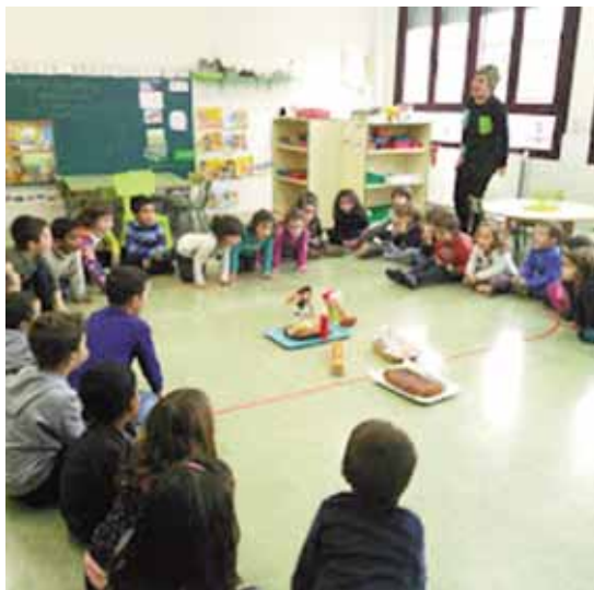
EUSKARAREN EGUNA/DÍA DEL EUSKERA.

POBREZIA ETA GIZARTE-BAZTERKERIA/CINE "POBREZA Y EXCLUSIÓN SOCIAL".