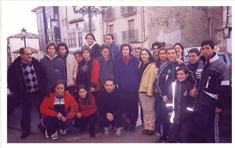
Errege Magoen Auroroen taldea. 1999-1-3. Grupo de auroros de los Reyes Magos, 3-1-1999.