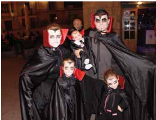
HALLOWEEN EGUNA/DÍA DE HALLOWEEN.