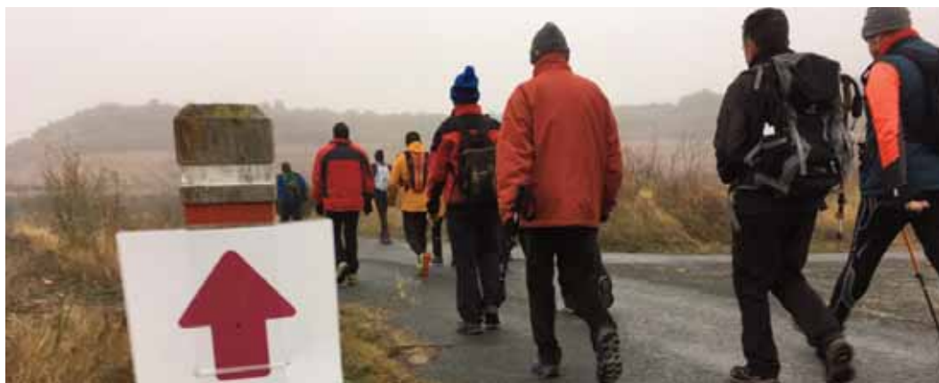
ARABAKO ERRIOXAN BARNA/MARCHA POPULAR POR RIOJA ALAVESA.

Antolatzailea/Organiza: Arabako Errioxako Ardoaren Ibilbidea/Ruta del Vino de Rioja Alavesa. Laguntzailea/Colabora: Oyón-Oingo Udala/Ayuntamiento de Oyón-Oion.