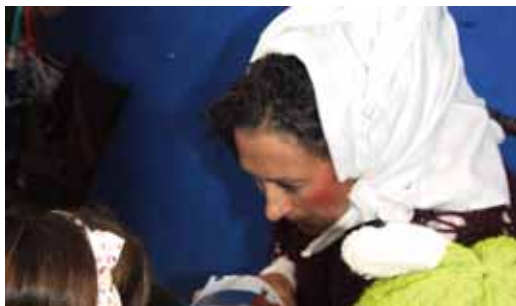
MARI DOMINGIRI GUTUNAK EMATEA/ENTREGA DE CARTAS A MARI DOMINGI.