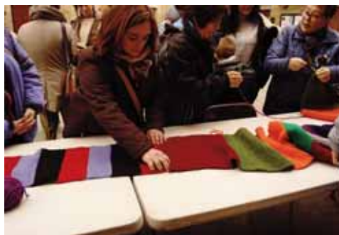
ARABAKO ERRIOXA INDARKERIA SEXISTAREN KONTRA SAREAK JOSTEN/RIOJA ALAVESA TEJE CONTRA LA VIO- LENCIA SEXISTA.