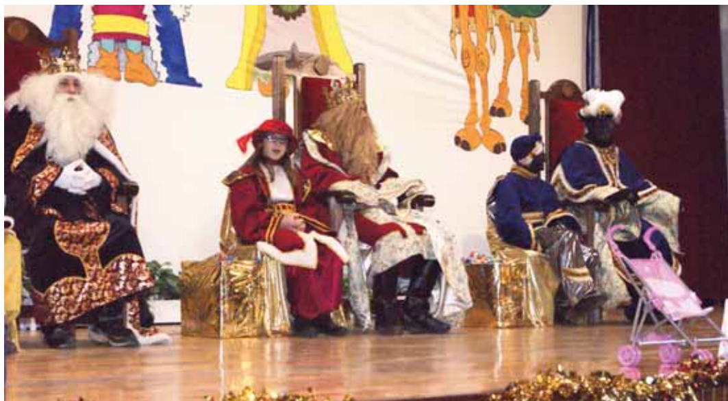
ERREGREEN DESFILEA/CABALGATA DE REYES.