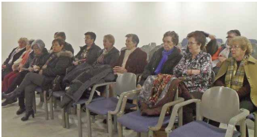
POBREZIA ETA GIZARTE-BAZTERKERIA: “TERRAFERMA” FILMA/CINE “POBREZA Y EXCLUSIÓN SOCIAL”. “TERRAFERMA”.