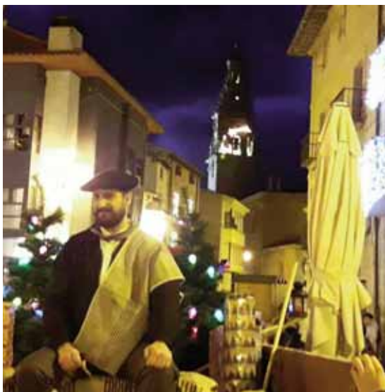
OLENTZEROREN ETORRERA/LLEGADA DEL OLENTZERO.