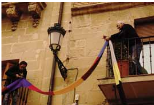
INDARKERIA SEXISTAREN AURKAKO EGUNA/DÍA CONTRA LA VIOLENCIA SEXISTA.