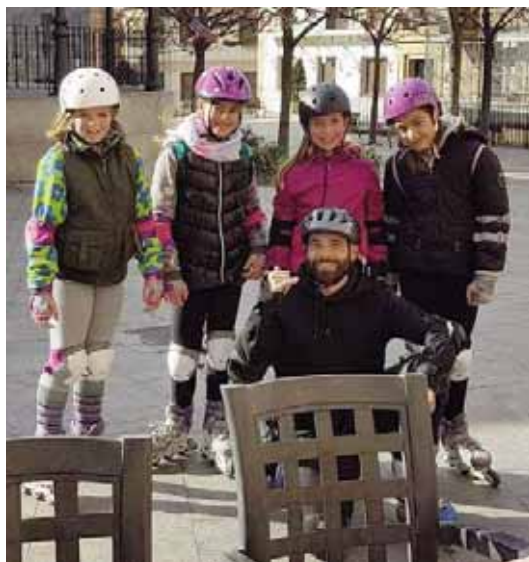
IBILALDIA PATINETAN/RUTA EN PATINES.