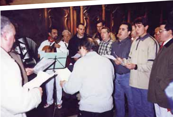
Parrokiako koroa Patroi Santuen Aurora kantatzen. 2000-1-22. Coro parroquial cantando la aurora de los santos patronos. 22-1-2000.