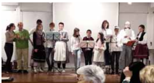
TXISTU-KONTZERTUA/CONCIERTO DE TXISTUS.