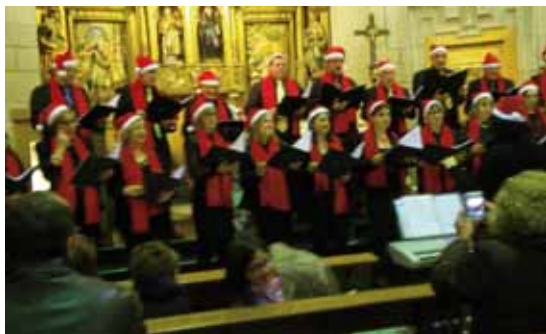
PRUDENTZIO EGUNSENTIAREN GABON-KANTEN KONTZERTUA/CONCIERTO DE VILLANCICOS PRUDENTZIO EGUNSENTIA.

Antolatzailea/Organiza: Prudentzio Egunsentia.