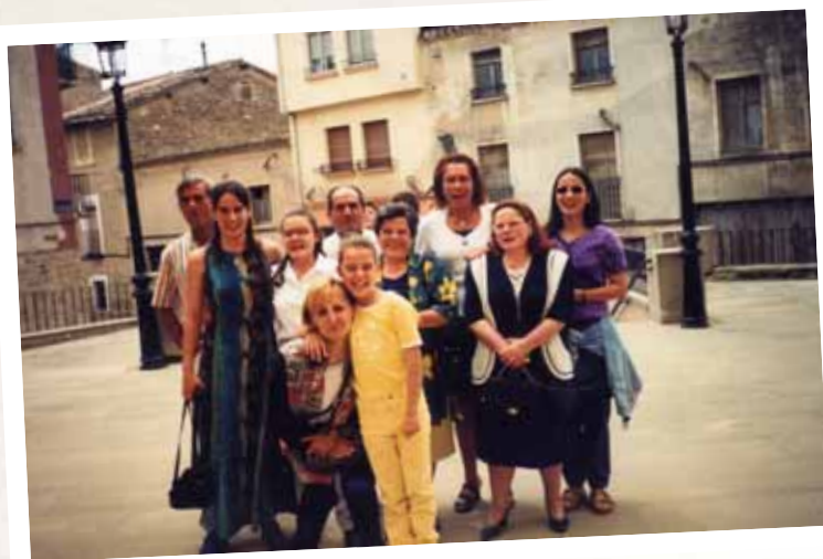
Argazkia/Foto: Natalia Saénz.