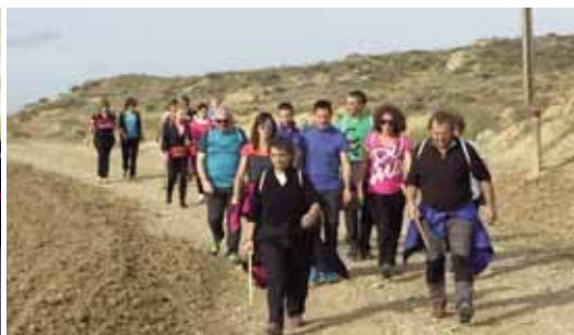
MINBIZIAREN AURKAKO MARTXA SOLIDARIOA/MARCHA SOLIDARIA CONTRA EL CÁNCER.