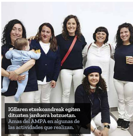
IGEaren etxeoandreak egiten dituzten jarduera batzuetan. Amas del AMPA en algunas de las actividades que realizan.